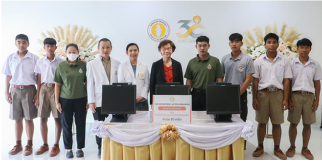
คณะแพทยศาสตร์